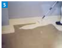
5 Mit einer Fellwalze gleichmäßig auftragen.