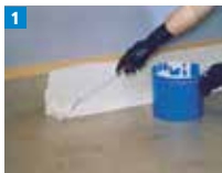
1 Abdichtungsharz satt vorlegen.

Beginnen Sie mit den Aufkantungen und arbeiten Sie Innen- und Außenecke gemäß Verarbeitungsanleitung aus.