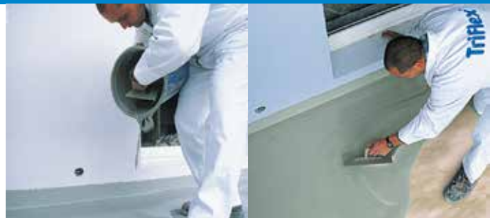
Triflex Flüssigkunststoff – Einfache Verarbeitung