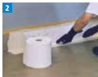
2 Triflex Spezialvlies in das vorgelegte Material blasenfrei einarbeiten.