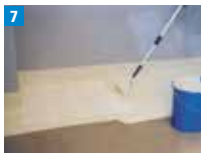
7 Das eingelegte Vlies mit einer ausreichenden Lage Harz abdecken.