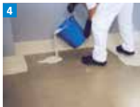
4 Auf der Fläche Abdichtungsharz satt vorlegen.