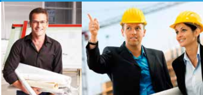
Triflex – Da bin ich mir sicher!